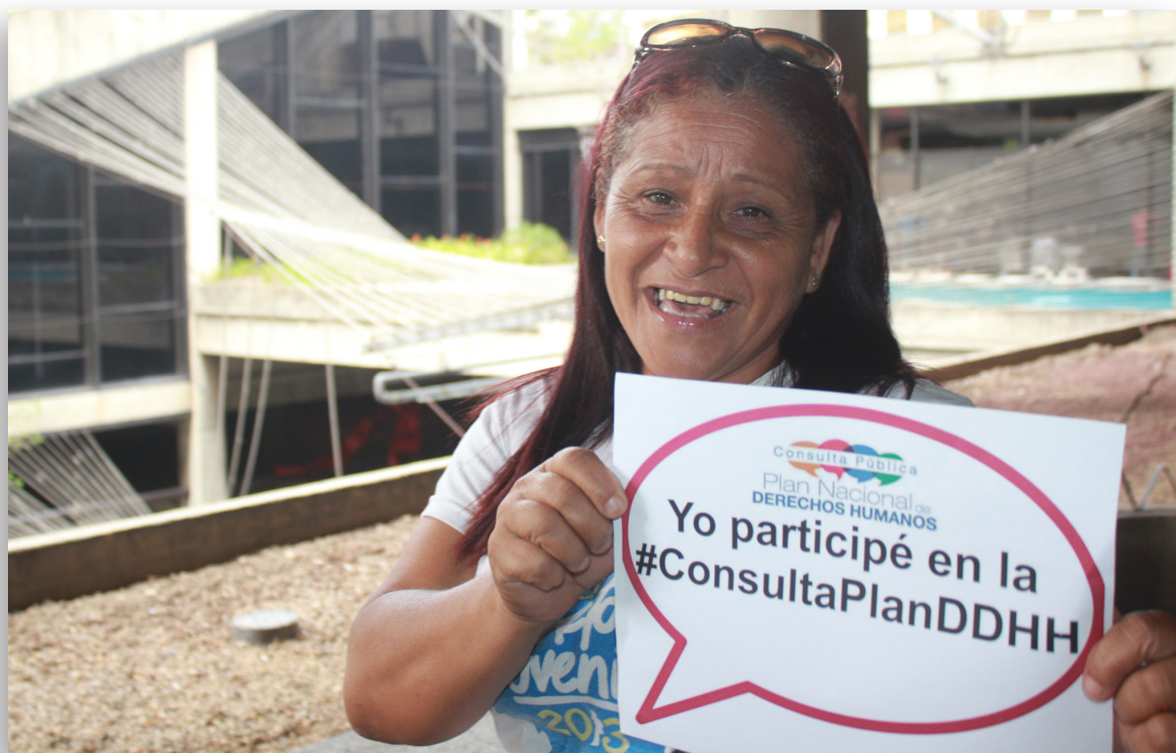
Consulta pública con movimientos de mujeres. Caracas, 12 de septiembre de 2015.