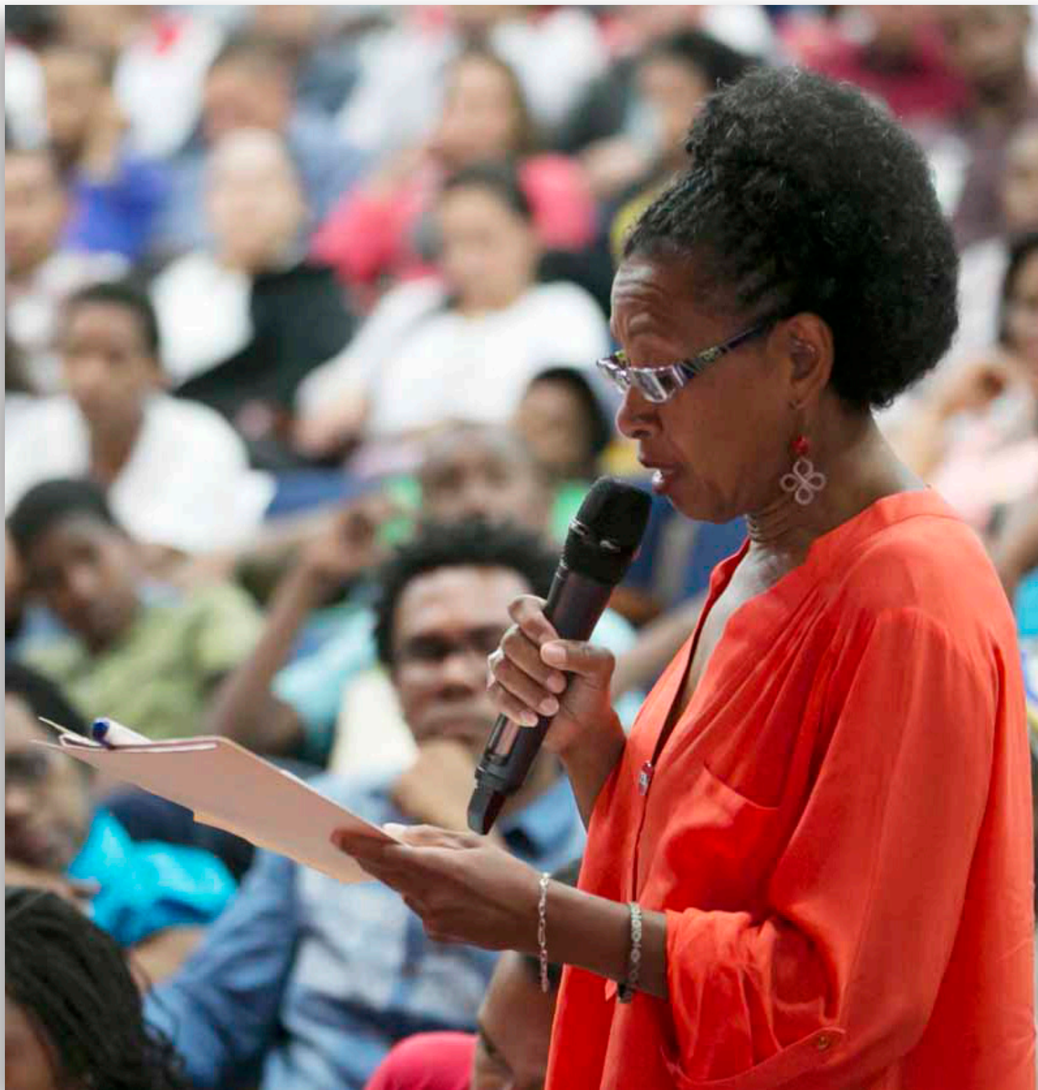
Intervención durante la consulta pública con movimientos afrodescendientes. Caracas, 14 de agosto de 2015.