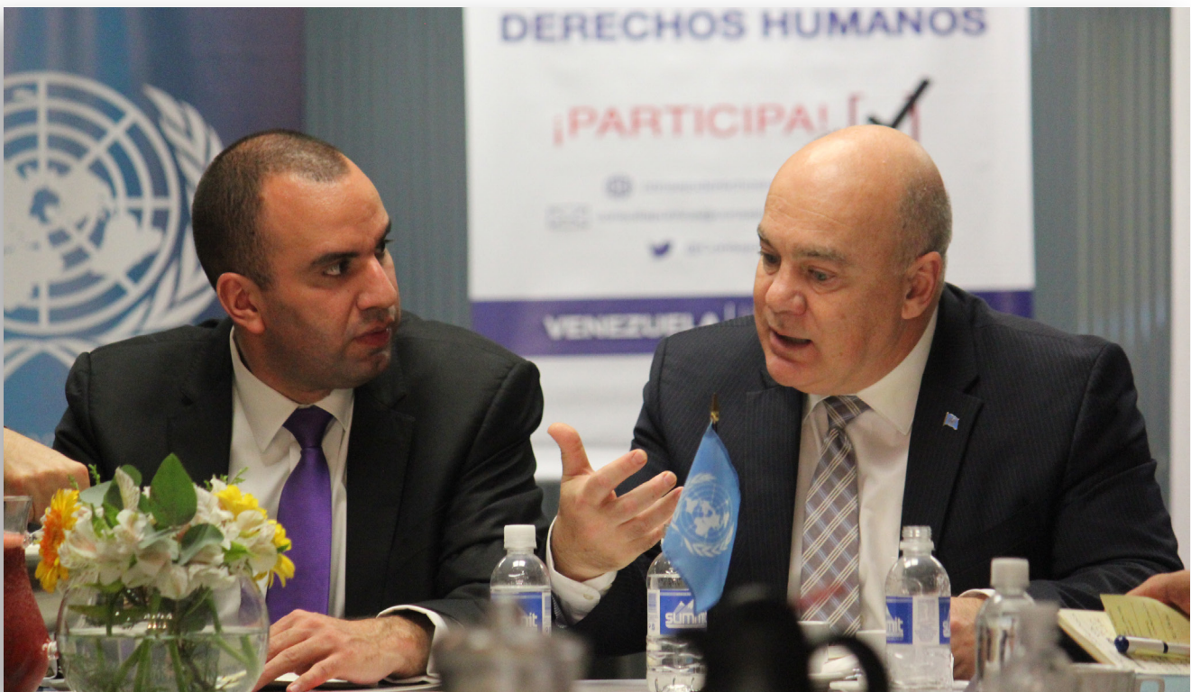
Consulta pública con Agencias del Sistema de Naciones Unidas acreditadas en Venezuela. Caracas, 21 de julio de 2015.