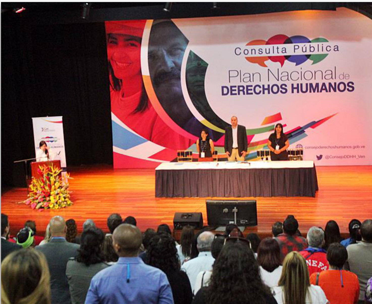
Consulta pública con organizaciones y movimientos de derechos humanos. Caracas, 27 de agosto de 2015.

El Plan Nacional de Derechos Humanos debe ser viable y realizable en el plazo previsto, y cumplirse e implementarse efectivamente.