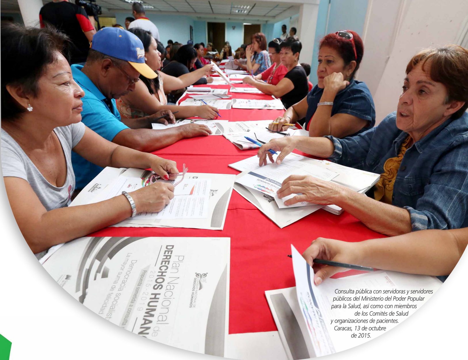
Consulta pública con servidoras y servidores públicos del Ministerio del Poder Popular para la Salud, así como con miembros de los Comités de Salud y organizaciones de pacientes. Caracas, 13 de octubre de 2015.