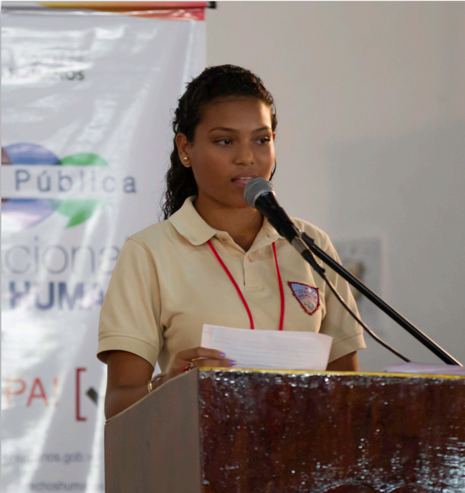
Consulta pública con estudiantes de Educación Media. Caracas, 13 de octubre de 2015.