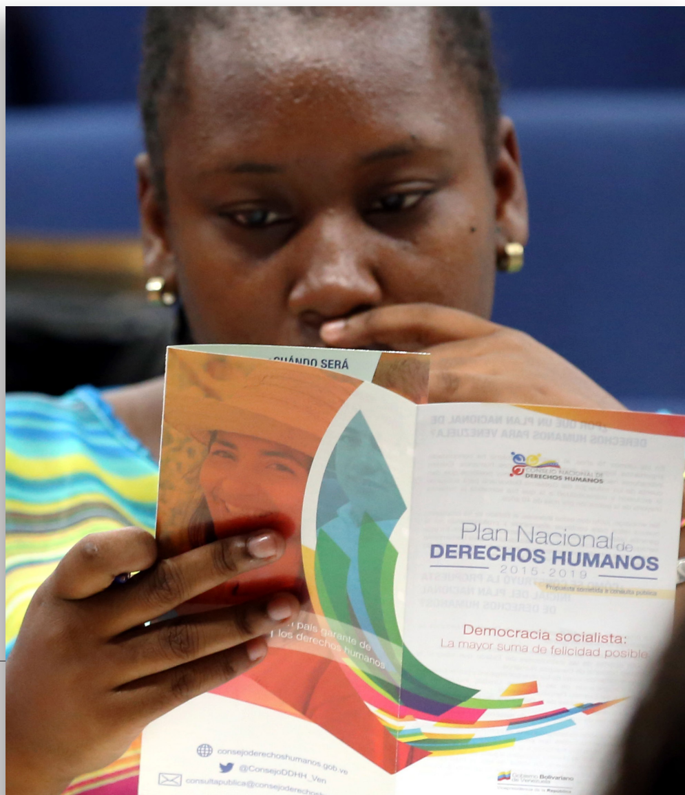
Consulta pública con movimientos afrodescendientes. Caracas, 14 de agosto de 2015.