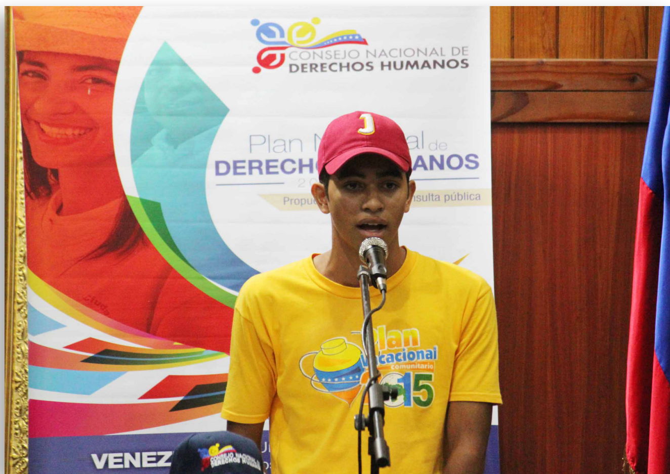
Consulta pública con adolescentes. Aragua, 24 de agosto de 2015.